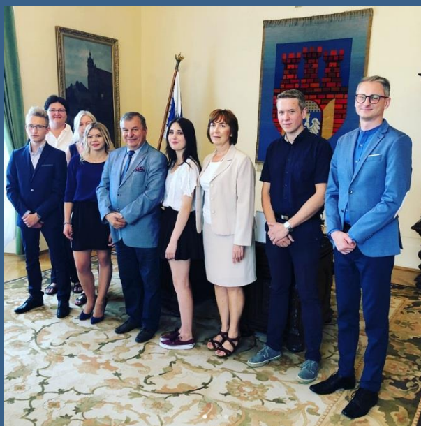
Spotkanie z laureatami konkursu wiedzy o samorządzie krakowskim